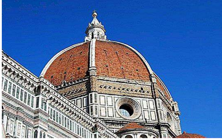
قبة كنيسة سانتا ماريا بفلورنسا 3 .

وعند عودته إلى فلورنسا كانت هناك مشكلة معمارية، وهي إنشاء قبة كنيسة (سانتا ماري) للقديسة ماري التي يبلغ قطرها أكثر من 130م، والخشبية من ثقلها والفراغ الكبير الذي يؤدي إلى انهيارها. وقد ظهرت براءة (برونلسكي) بأن وجد حل بعد أن يقطع الجانب العريض منها، وقد حاول بأسلوبه الجديد الواضح أن ينجح في بناء القبة التي يبلغ ارتفاعها 133م تحتلي الكنيسة لحد الآن 2 .