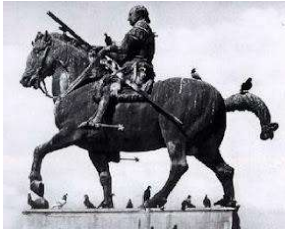
الفارس جاتاميلانا فوق جواده- بادوا.

كما نجد تمثال (دوناتيلو) الشهير المعروف باسم (الفارس جاتاميلانا) احد قادة جمهورية البندقية، فهو أول تمثال من البرونز يمثل هذه الضخامة منذ عصر الامبراطورية الرومانية، وينتصب بمدينة (بادوا)، حيث عمل (دوناتيلو) خلال عشرة أعوام بين (1443-1453)م ، ومما لا شك فإنه استوحى تصميم هذا التمثال من تمثال الامبراطور (ماركوس أوريليوس) الذي شاهده (دوناتيلو) ممتطيًا صهوة جواده أثناء رحلته إلى روما 1 .