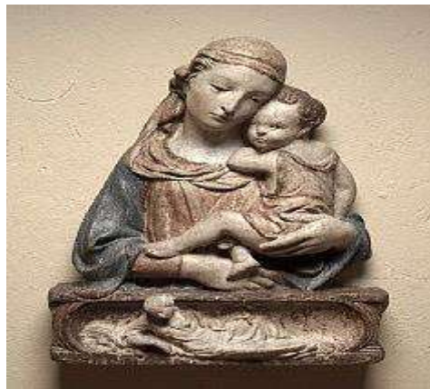
تمثال مادونا والطفل سنة 1450م.