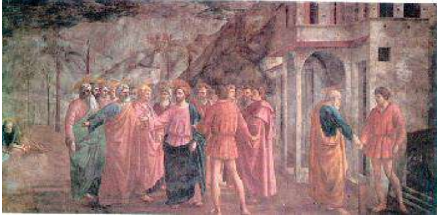
لوحة دفع الجزية 4 .

كما أن الحركة التي تزعمها مازاتشيو تهدف إلى الخروج بالتصوير من التقاليد الدينية، وذلك عن طريق الاهتمام بدراسة الإنسان ومظاهر الطبيعة وتصوير الأشخاص العاديين، وقد استفاد من التجارب في ميادين النحت والعمارة بعمل القبة الفخمة التي أقامها على القاعدة المثلثة الموجودة في كاتدرائية فلورنسا (سانتا ماريا)، بعدها ذهب إلى روما لدراسة العمارة ودرس قوانين المنظور العلمية. ومن أبرز أعماله لوحاته جدارية في كنيسة سانتا ماريا ديل كارمن في فلورنسا عام 1427م، وفيها توضح موضوعات متعددة من الإنجيل، نجد مثلاً: لوحة (دفع الجزية)، ولوحة (آدم وحواء مطرودين من الجنة) 3 .