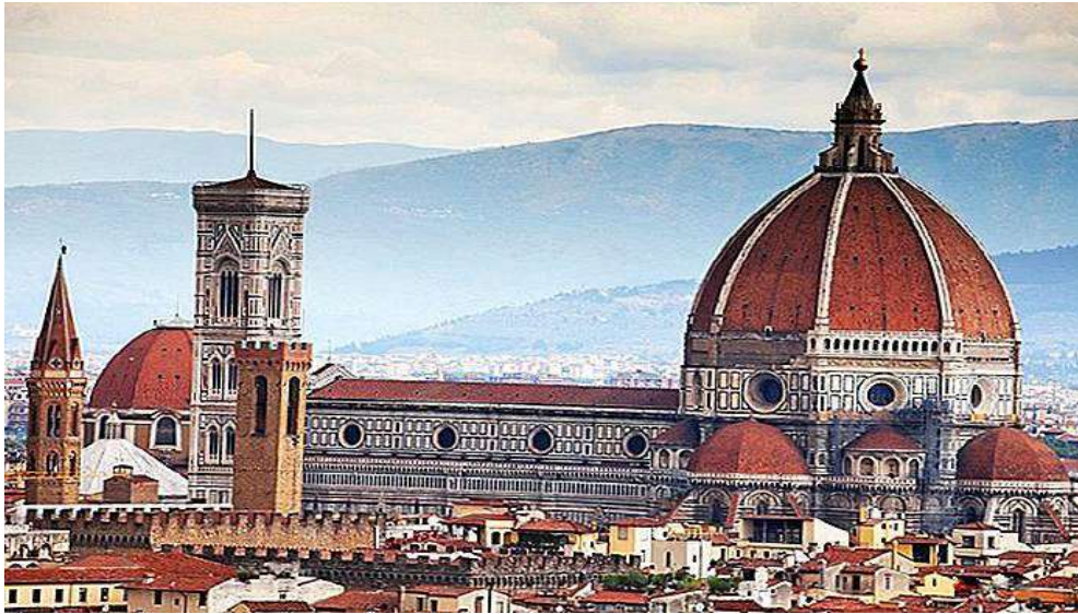
كنيسة فلورنسا في ايطاليا 2 .