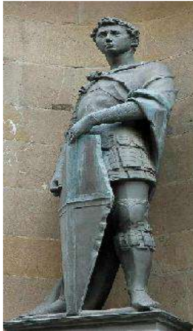
تمثال القديس جورج.

يعتبر من أشهر نحّاتي النهضة المبكرة وكان موهوباً، وتعود موهبته إلى ابتكار أسلوب لا يخضع لتقاليد الفن القديم، وإنما يأخذ أحسن ما فيها ليدمجها في طابعه الذاتي الذي يعكس صفاته المميزة . فكان أول الفنانين الذين نبذوا الطراز الغوطي بعد عودته من روما، واتجه إلى تأييد الحركة الجديدة التي تهدف إلى الاهتمام بدراسة الإنسان، وتظهر في أعماله ابتكارات جديدة أهمها الإحساس بالواقعية والدقة في المحاكاة 1 ، وقد تبدو طبيعة دوناتللو في محاولة بعث الحياة في نماذج مثالية فلورنسية، ميرزا العضلات والتعبير عن قوة الأشخاص من قمة الرأس حتى أخمص القدمين، وقد أبدع دوناتللو بنحت الأطفال، والشخصيات النصفية، ويعد أول من ابتدع التماثيل النصفية في عصر النهضة، ومن أشهر تماثيله تمثال " القديس جورج"، وتمثال " داوود ينتصر على جوليات"، و"القديسة العذراء والطفل" الذي نحتته من الخشب 2 .