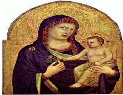
صورة العذراء والطفل

ابتدأ جيوتو حياته الفنية سنة (1298م) بالموزايك (الفسيفساء)، ثم انتقل إلى التصوير بالفريسكو على الجدران تعبر بشكل واضح عن روحية العصر الجديد، نجد أشهر أعماله (لوحة العذراء والطفل) صورها بألوان الفريسكو لإحدى كنائس فلورنسا. فهو أول من ابتدع ظهور المشاهد الخلفية في لوحاته الزيتية، مثل لوحة (القديس فرنسيس يتخلى عن ممتلكاته) 3 .