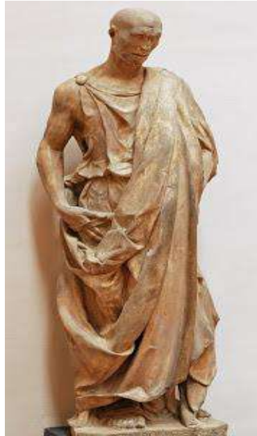
تمثال لوكزيولي الأصل 4 .

كانت التماثيل المنحوتة من طرف النحات (دوناتيلو) تنطوي على طاقة عنيفة، حيث كانت أكثر موضوعاته تدور حول أبطال من الشباب اشتهر عنهم مقاومة البطش، والطغيان بمفردهم 3 .