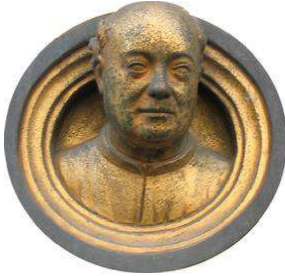
تمثال غيبرتي في بوابة الفردوس.

لهذا نجد العديد من اللوحات التي نُحِثها الفنان غيبرتي: