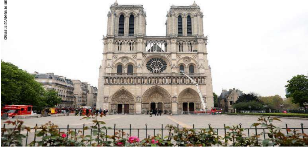
كاتدرائية نوتردام في فرنسا 1 .

كما زخرفت الكنائس الغوطية بمنحوتات بارز واضحة استمد النحات موضوعاتها من الكتب المقدسة، الثوراة والإنجيل، وقد تظهر الأشخاص المنحوتة في الواجهات الكاتدرائيات، وقد اتجه فن النحت إلى أكثر واقعية في إيطاليا على يد النحاتين (نيقولا بيزانو، وابنه جيوفاني بيزانو)، وكان أسلوبهما متأثرا بالأمثلة الكلاسيكية 2 .