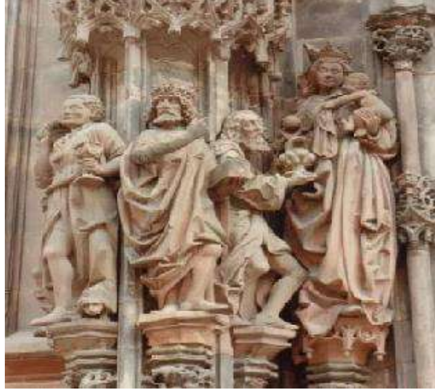
منحوتات قوطية من كاتدرائية ستراسبورغ، فرنسا 1 .

أما فيما يخص التصوير بدأ في فن الزجاج، نتيجة امتلاء الكنائس الغوطية بالنوافذ العالية، وقد نتج عن ذلك زخرفة النوافذ بلوحات رسم من الزجاج الملون، أطلق عليه بـالزجاج المعشق (فهو عبارة لوحة تتكون من مئات من قطع الزجاج الصغيرة المتعددة الألوان، وترتبط هذه القطع مع بعضها بواسطة معدن الرصاص) 2 .