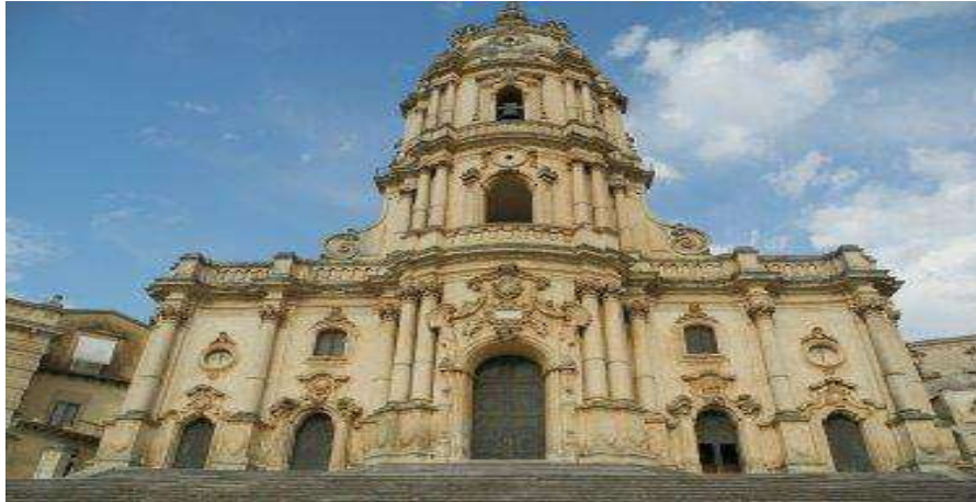
كنيسة مونتريال بصقلية الايطالية 4 .