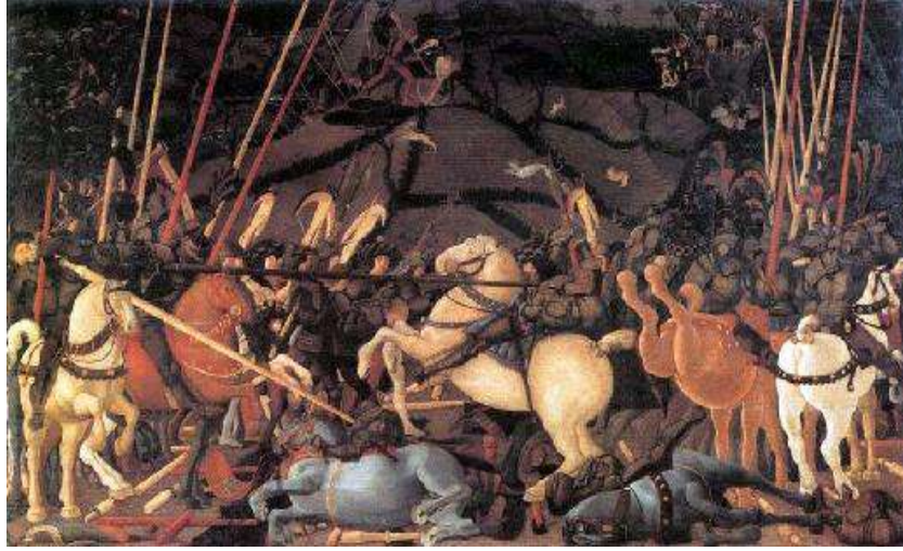
لوحة معركة القديس رومانو.

كان من أكثر فاني عصره اهتماما بدراسة فن المنظور، ومن أشهر لوحاته اهتمامه بالعمق مستمدة من التاريخ تمثل (معركة القديس رومانو) يتوسطها القائد (نيكولو موروتشي) فوق صهوة جواده 1 .