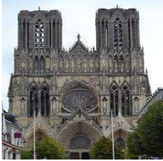
كاتيدراية ريمس في فرنسا 1 .