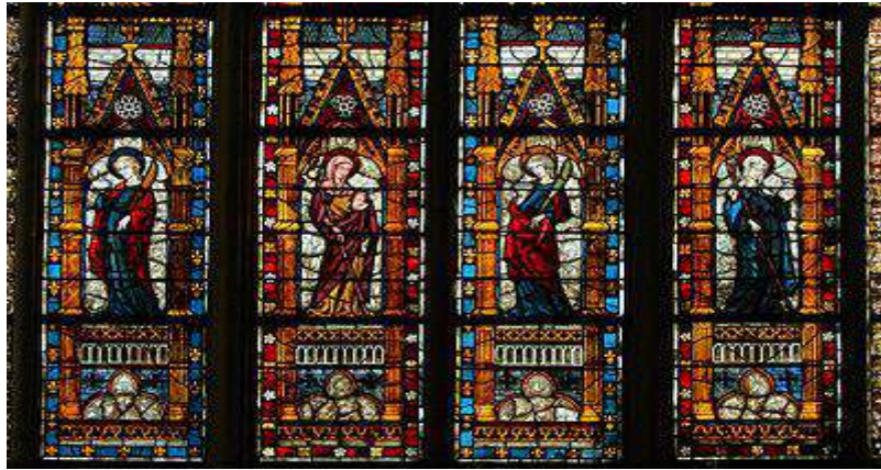
الزجاج المعشق في كاتدرائية تروا بفرنسا (القرن الرابع عشر) 3 .

أما فيما يخص التصوير بدأ في فن الزجاج، نتيجة امتلاء الكنائس الغوطية بالنوافذ العالية، وقد نتج عن ذلك زخرفة النوافذ بلوحات رسم من الزجاج الملون، أطلق عليه بـالزجاج المعشق (فهو عبارة لوحة تتكون من مئات من قطع الزجاج الصغيرة المتعددة الألوان، وترتبط هذه القطع مع بعضها بواسطة معدن الرصاص) 2 .