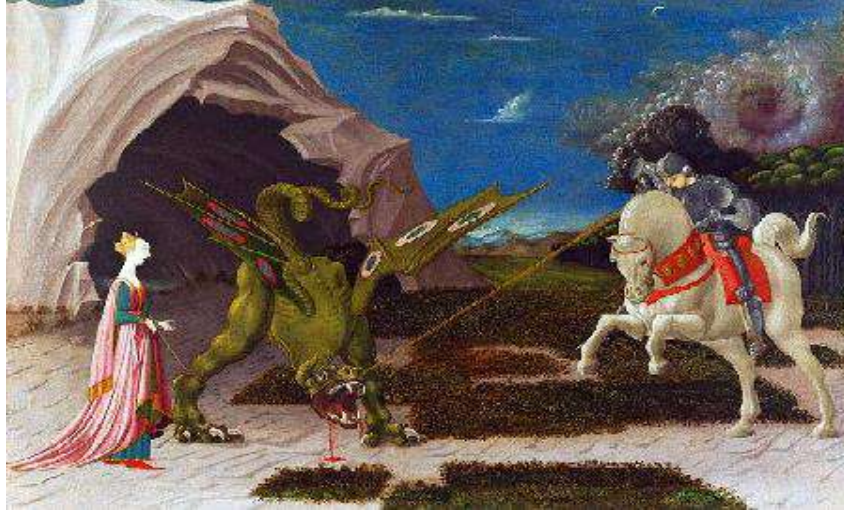
لوحة القديس جورج والتنين.

كما اهتم الفنان (أوتشيللو) بالحيوان في إبرازه لخصائص الجواد والتنين في لوحة (القديس جورج والتنين) التي سجل فيها أسطورة ذلك القديس وهو يقضي على التنين لينقذ أميرة كبادوسيا ، وقد اهتم بالقيم الملمسية واللون، واستخدم موهبته في إيضاح المسائل العلمية 1 .