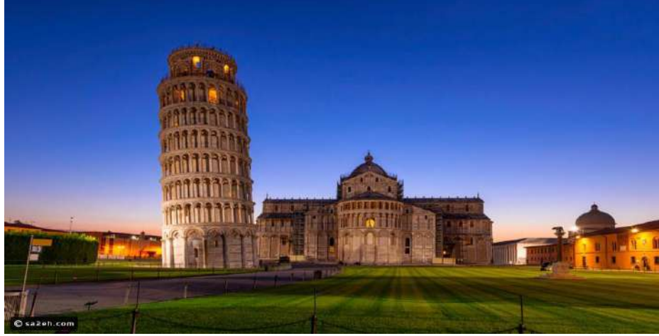
كاتيدراية بيزا في ايطاليا 3 .