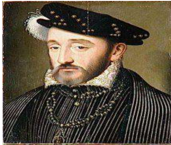
Joachim Du Bellay

Les imprimeries se multiplient grâce aux privilèges royaux obtenus par les éditeurs. La plupart des écrivains y publient leurs œuvres. En 1500, on compte librairie (lieu ou on imprime édite et vend les livres) quarante villes sont dotées d'une librairie chacune en France. Le livre en format réduit se répand favorisant le gout pour l'érudition et la diffusion des idées humanistes.