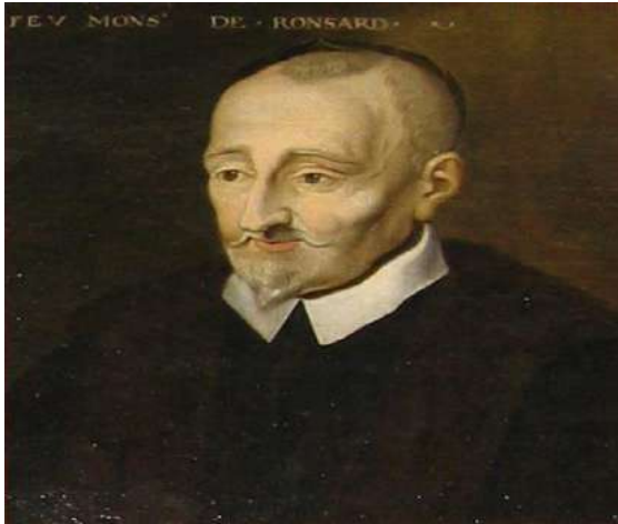
Pierre de Ronsard